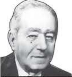
بولس سلامة شاعر لبناني مسيحي

لا ترانا نرمي البواتر حتى لا نُبقي منها سوى القبضات ليتنا يا حسين نسقط صرعى ثم تحيا الجسوم في حيوات وسنفديك مرة بعد أخرى ونُضحّي دماءنا مرات