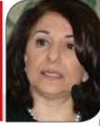
بثينة شعبان *