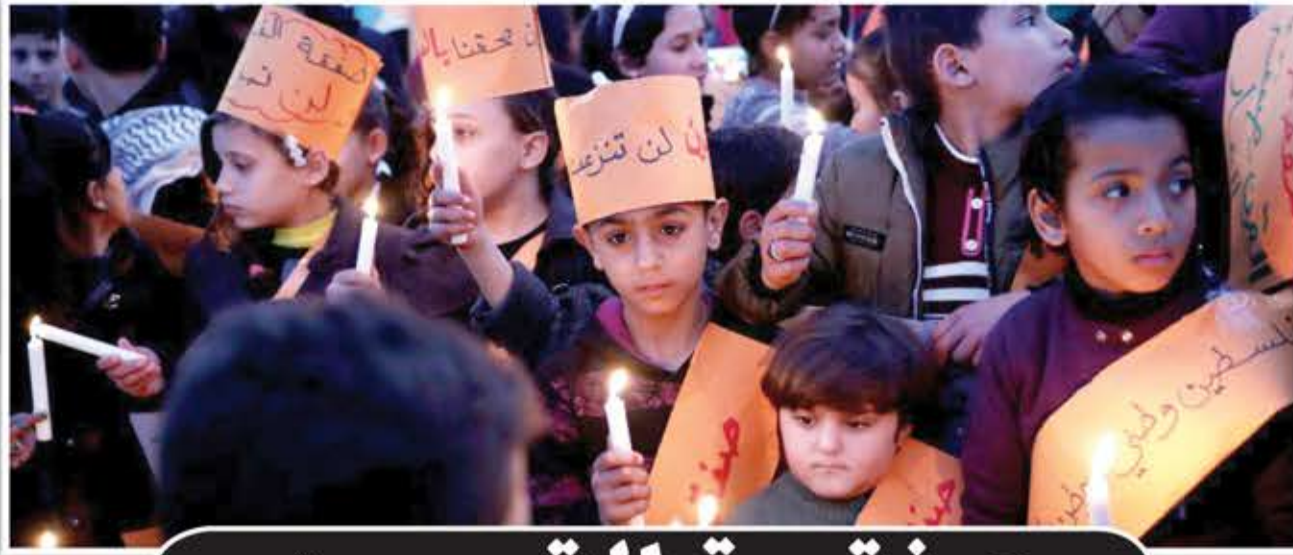
سي جي ويرلمان مجلة إنسايد أرابيا (Inside Arabia) الإلكترونية