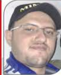
عبد الملك سام

لقد ارتبطت هذه الأسرة بأبشع سمعة في التاريخ من حيث الممارسات الغريبة والوحشية والقاسية، وللأسف ما زال نجد هناك من ينخدع بالمظاهر المادية التي خدع بها فرعون بني إسرائيل عندما تباهى بما يملك وفقر سيدنا موسى، ورغم ما نشاهده من ارتباط بين هذا النظام والكيان الصهيوني من تطبيع علني يتم على مراحل يهدف للسيطرة على المقدسات الإسلامية واحداً تلو الآخر، ورغم اكتشاف الكثير من الحقائق التي تثبت أن هؤلاء مدعي الإسلام لم ولن يفعلوا شيئاً في مصلحة الإسلام والمسلمين طوال تاريخهم الأسود، بل أن كل تشويه لحق بسمعة الإسلام ارتبط بشكل أو بآخر بهذا النظام المدسوس علينا.