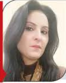
أكاديمية وكاتبة سورية.