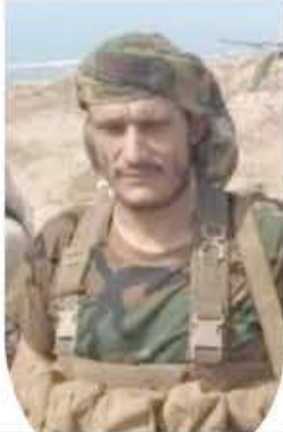
أبين - "لا"

لقي مصرعه في المعارك التي تدور حالياً في مدينة زنجبار. وذكرت المصادر أن مليشيات "الانتقالي" دفعت بتعزيزات عسكرية إضافية إلى زنجبار لتعزز صفوف قواتها التي تخوض معارك متواصلة مع قوات العميل هادي في عدد من مديريات محافظة أبين.