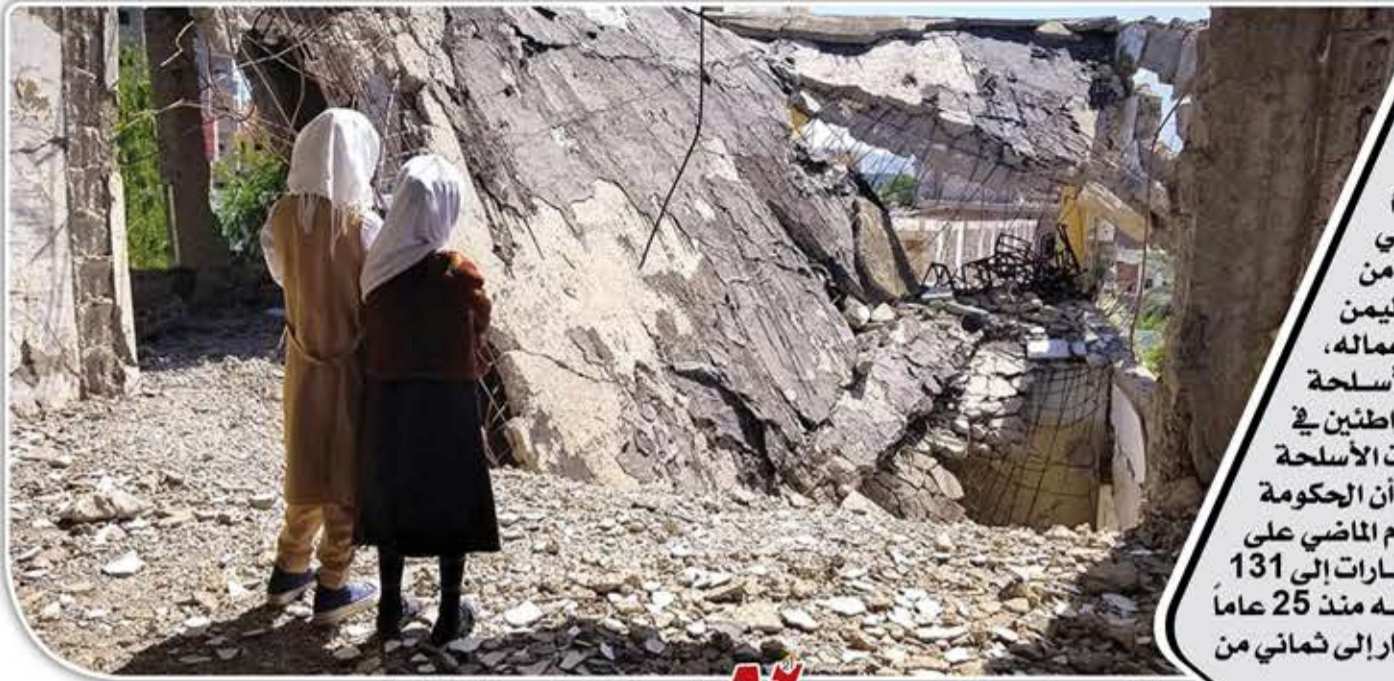
ترجمة خاصة عن الألمانية