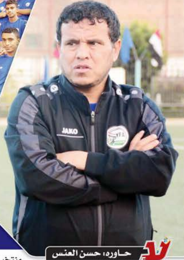
حاوره: حسن العنسي