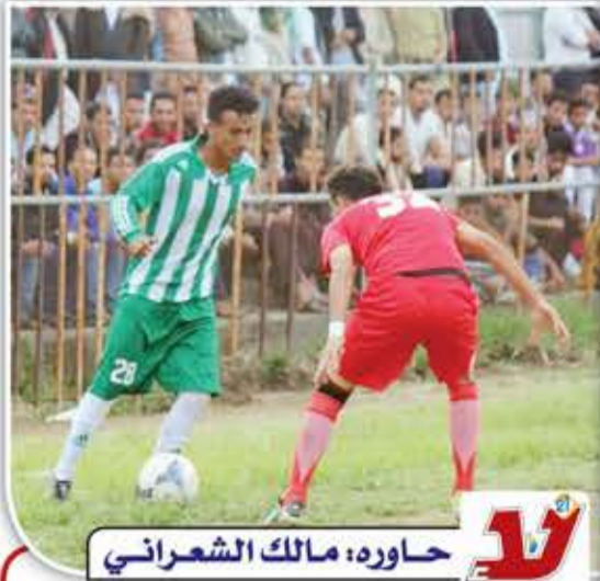
حاوره: مالك الشعراني