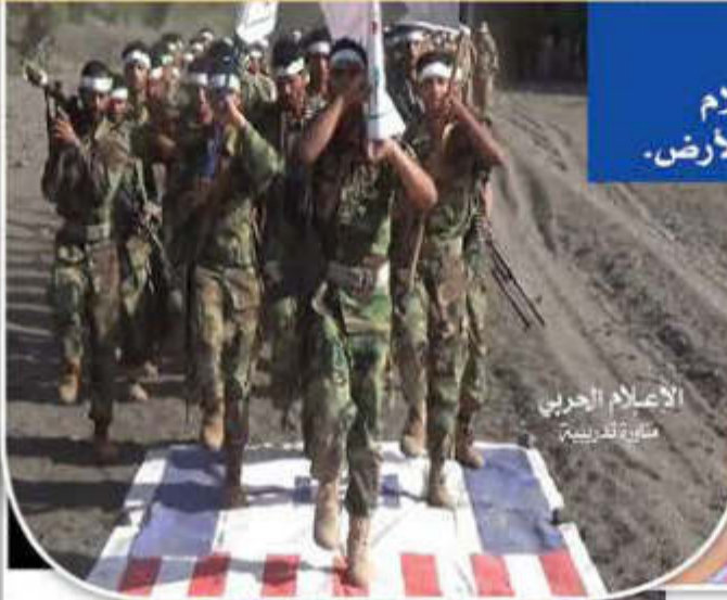
الاعلام الحربي مشيرة لتدريب