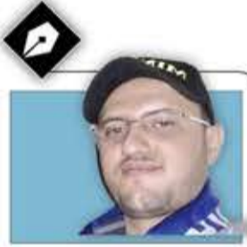
عبد الملك سام

النار: فلا شبهة هناك ولا ضبابية. من هنا تأتي أهمية إحياء يوم عاشوراء، فالباطل لا يستطيع أن يزيغ حقيقة رجل عظيم كالإمام الحسين وما حدث له ولأصحابه في هذه الواقعة، فإذا كذب بشأن سبب خروج الإمام الحسين فلن يستطيع أن يبرر الوحشية التي ارتكبت بها الجريمة، ولن يستطيع أن يلصق صورة المجرم السكرير يزيد مع ما كان يفعله من فساد بواح، ولن يستطيع أن يفسر ماذا حدث بعد الجريمة من رفعة ومحبة اكتسبها الإمام الحسين وأهله، وما لحق بقاتليه من لعنة واضمحلال وبغض في قلوب الناس. لذلك لم يكن أمام الباطل من وسيلة سوى أن يحاول أن ينسى الناس ما حدث في كربلاء! علاقتي مع الإمام الحسين هي محاولات للاقتداء بنموذج عظيم قلما وجد له شبيهه، ولكن يبقى أن نتعلم منه قوة الإيمان والصبر على البلاء، ونتعلم منه ألا نسمح بأن نغيرنا الظروف مهما كانت الصعاب، نتعلم منه الإياء والشجاعة ونحن نواجه التحديات. الإمام الحسين ثورة متجددة ضد كل الشر الذي يمكن أن نواجهه، ومدرسة عظيمة لا حدود للاستفادة منها. السلام على الحسين وعلى من سلك طريق الحسين.