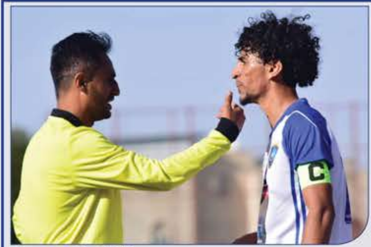
صيد الكاميرا

إشراف: طلال سفيان Talal.sofyan@gmail.com تصميم وإخراج فني: سليم الخطيب