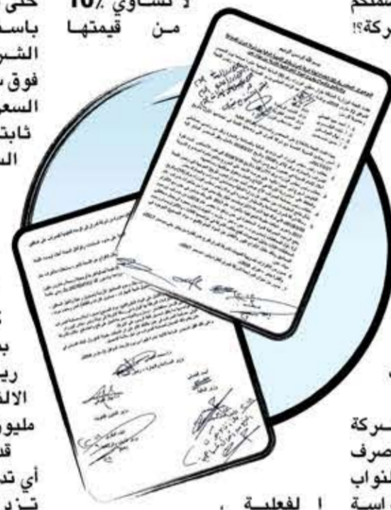
صورة مع التحية - لقائد الثورة.