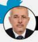
الشيخ حسين حازب

لو أن أبناء مأرب الذين يدافعون عن "الشرعية" ويقدمون أبناءهم قرابين لأجلها، يطلبون ممن فاوض ووافق على تبادل الأسرى معلومات عن الأسرى الذين تم الإفراج عنهم في عملية التبادل، ويسألونهم أين الأسرى من أبناء قبائل مأرب؟! الإجابة إن حصلوا عليها ستوضح لهم أين تضعهم هذه "الشرعية" وقادتها!