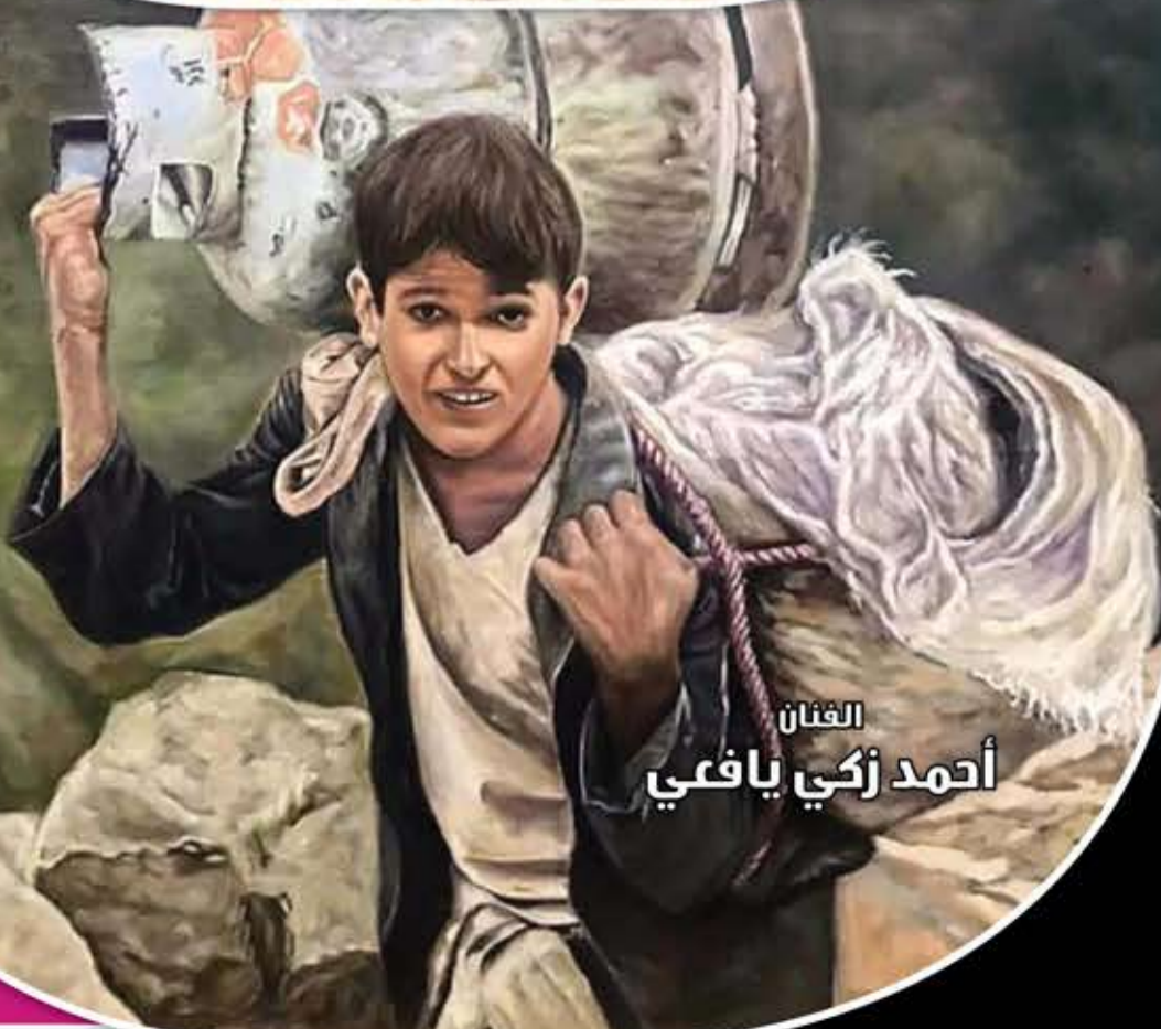
الفنان أحمد زكي يافعي