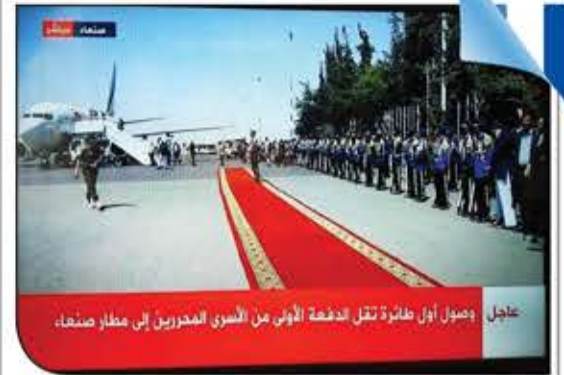
عاجل وصول أول طائرة نقل الدفعة الأولى من الأسرى المحررين إلى مطار صنعاء.

إذا تشتي تعرف ليش الحوثي بينتصر، شوف كيف بيعامل المقاتلين حقه. هذا في استقبال الأسرى المفرج عنهم، والمقدشي بياكل معاشات المقاتلين حقه!