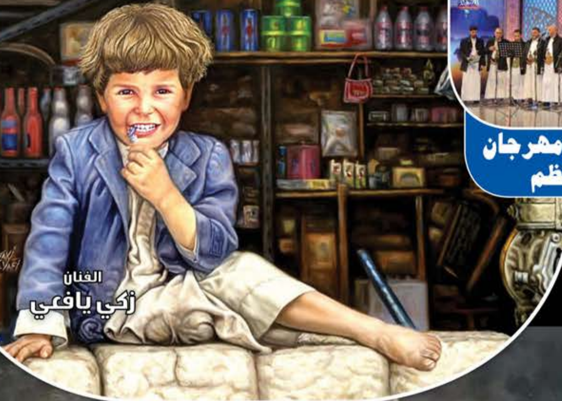
الفنان زكي يافعي

تواصل فعاليات مهرجان الرسول الأعظم بجامعة صنعاء في مختلف الأنشطة الأدبية والثقافية. وبدأت منافسات مسابقتي الشعر والإنشاد، التي تستمر 9 أيام، بمشاركة عدد كبير من المنشدين والشعراء، حيث يتنافس 3 شعراء و3 منشدين على المراكز الأولى، وفي تقديم وصلات شعرية وإنشادية في مدح الرسول الأكرم بألوان ولهجات يمنية مختلفة. كما تم افتتاح المعرض الكاريكاتيري بعنوان «سراجاً منيراً»، والذي يحتوي على 130 لوحة كاريكاتيرية معبرة عن رفض الإساءة للرسول الأعظم صلى الله عليه وآله وسلم، وأدوات الحرب الناعمة ومواجهة التطبيع. وفي مجال المسرح، تواصل العروض المسرحية التي تقدمها عدد من الفرق من مختلف المحافظات في إطار تنافسها على أفضل عمل مسرحي. ويتخلل الفعاليات أمسيات على مسرح الهواء الطلق يخوض فيها متنافسون في مجال الزامل وتقديم فقرات فنية وفلكلور شعبي احتفاءً بهذه المناسبة الدينية الجليلة.