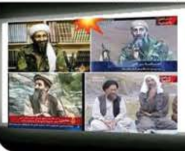
كم كنا سذج!!!

كانت قناة الجزيرة تقوم بإجراء لقاءات وفعاليات خاصة مع بن لادن في كهوف وأحراش أفغانستان، بينما أمريكا وأجهزة المخابرات العالمية تبحث عنه. كم كنا لسطاء وفقلاء.