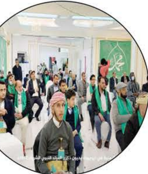
في نيويورك احتفلت الجالية اليمنية في ولاية نيويورك الأمريكية، بمناسبة المولد النبوي.