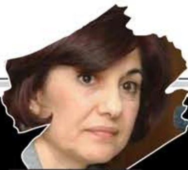
د. بثينة شعبان *