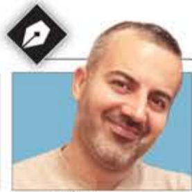
يسار عبد الله*

الملايين التي خرجت في 12 من ربيع الأول، والحضور الكبير والمشرف رغم التهديدات وظروف العدوان والحصار والتجويع، تلك الحشود جسدت مدى حب الشعب اليمني لخاتم الأنبياء والمرسلين وارتباطهم الوجداني بما جاء به، واقتداء بنهجه وسيرته العطرة، ورداً قوياً على الإساءات الفرنسية، إلى جانب ما تمثله من محطة هامة باتجاه تعزيز الصمود ومواجهة العدوان الظالم. الإصرار الشعبي على الحضور القوي والكبير والحاشد، والاستجابة للدعوة التي وجهتها القيادة الثورية، تلك الاستجابة وذلك الحضور الهائل يعتبران المصدر الحقيقي للشرعية والثورة، وإعلاناً مزلزلاً للتمسك بالثورة وأهدافها ومبادئها وقراراتها السيادية والنضال في صفوفها مهما كانت التضحيات وحجم العدوان ومراحله حتى تحقيق النصر وهزيمة العدوان الهيجي وأدواته من القوى الضالة التي استمد العدو شرعيته من خلالها وأصبحت بعد ذلك متناثرة في ساحات الأنظمة الفاسدة تقعات من بقايا مخلفات العدوان كالأيتام على مائدة اللثام، ومع ذلك لا يتوقف ضجيجهم عن العفة والوطنية والاستقلالية والشرعية،