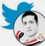
محمد سعيد الشرعبي

يفرضون على المواطن خياراتهم غير الوطنية، ويتركونه وحيداً يكتوي بنار الحرب والمجاعة والأوبئة، ويتفرغون هم لبناء أنفسهم وتأمين حياة أسرهم خارج البلاد. ولو انتقدت هؤلاء السفلة يقفز قطيعهم للدفاع عنهم.