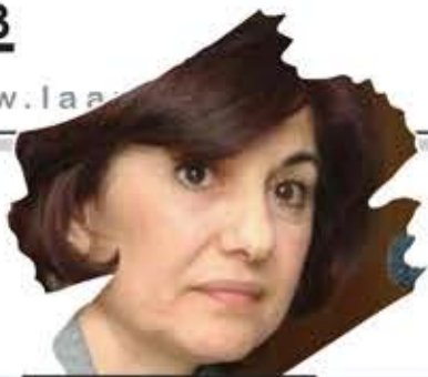
د. بثينة شعبان *