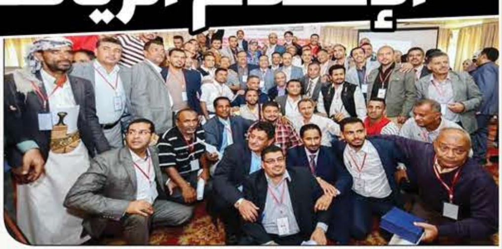
تحقيق: طلال سفيان

الإعلام الرياضي اليمني مشكلة وحالة عويصة تتعقد أكثر منذ عقدين من الزمن. مشاكل وانقسامات وولاءات وطوابير تلهف على السرفريات وما بينها دخلاء كثير، البعض يوجه إليهم أصابع الاتهام بأنهم مصدر الاساءة. ملحق "لا الرياضي" يفتح هذا الملف ويستعرض ما يقوله أبناء المهنة ورؤساء اتحادات ورياضيون ومتابعون في هذا التحقيق البسط.