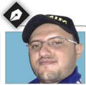
عبد الملك سام

لقد حاول اليمنيون تحت وطأة النظام السابق أن يصبروا على ما مسهم من ضراء، فلم يسعفهم هذا الصبر، وكان أن استجاب لهم القدر، فكانت ثورة الـ 21 من أيلول 2014، فندعو لها بالثبات وحسن القدوة.