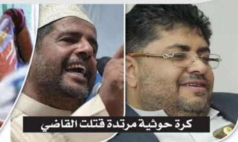
كرة حوثية مرتدة قتلت القاضي

الجرحي لإجراء عمليات تجميلية أو لغرض السفر للنزهة والاستجمام في الخارج، في الوقت الذي تم استبعاد أسماء جرحى حقيقيين من كشوفات اللجنة الطبية، لعدم توافق تركيبة أو وساطة من قبل أحد قيادات أو مشائخ الإخوان الزائفين.