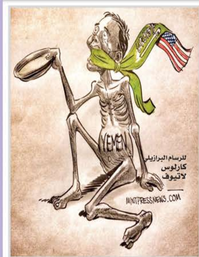
لرسم البرازيل كارلوس لاتيوف