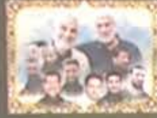
الاستشهاد السنوية الأولى لاستشهاد الحاج قاسم والحاج أبو مهدي ورفاقه 22 فبراير 2021 - 19 فبراير 1982

اعتبر سيد المقاومة السيد حسن نصر الله، الشهيد قاسم سليمان والشهداء القادة في دول المقاومة أبطالاً عالميين يحتذى بهم كل المقاومين في العالم. وقال سيد المقاومة في كلمة له أمس الأحد بمناسبة الذكرى السنوية الأولى لاستشهاد الحاج قاسم سليمان والحاج أبو مهدي المهندس، إن الشهيد سليمان بطل عالمي يحتذى به كل مقاومي هذا العالم، وإلى جانبه أبو مهدي المهندس والحاج عماد مغنية والسيد مصطفى بدر الدين والشهداء القادة في اليمن وفلسطين. وأضاف نصر الله: "نعرف كيف نحول الدم المسفوك ظلماً إلى دافع قوي للاستمرار والثبات والصمود والإحساس بالمسؤولية"، مخاطباً العدو الأمريكي وكيان العدو الصهيوني بأن